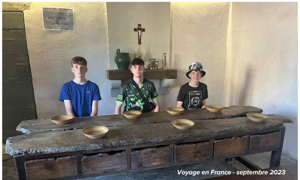
Voyage en France - septembre 2023

Le podcast Marist a été mis en place par les dirigeants Maristes pour diffuser des informations sur les événements et les différentes choses qui se passent à l'école. Les animateurs du podcast interviewent également diverses personnes