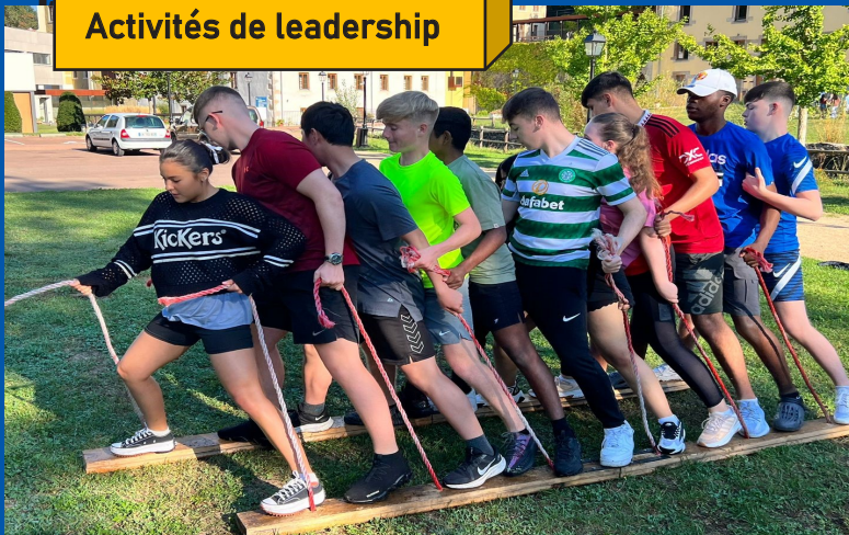
Activités de leadership