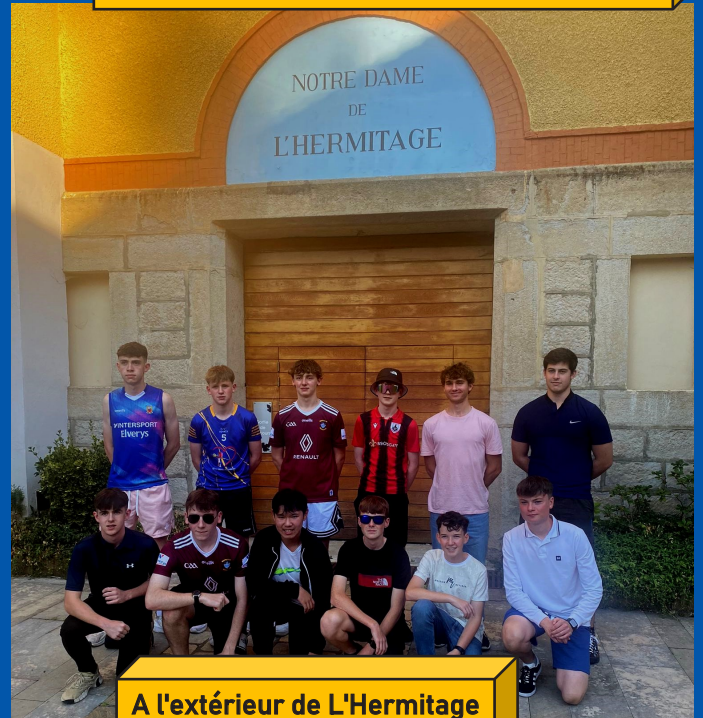
A l'extérieur de L'Hermitage