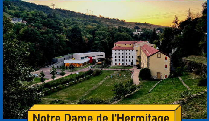
Notre Dame de l'Hermitage