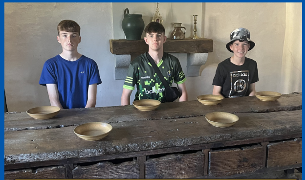
Table originale utilisée par Marcellin