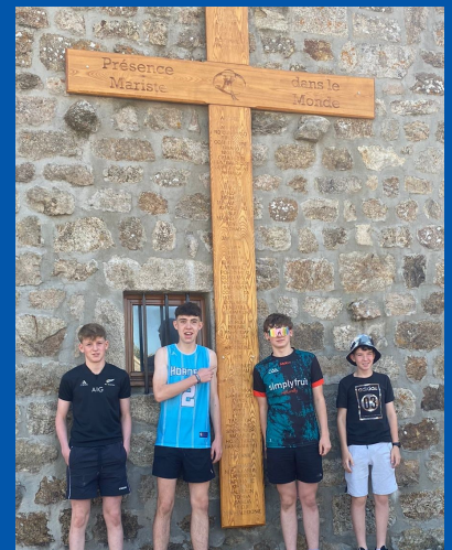
Croix de tous les pays où il y a une présence mariste