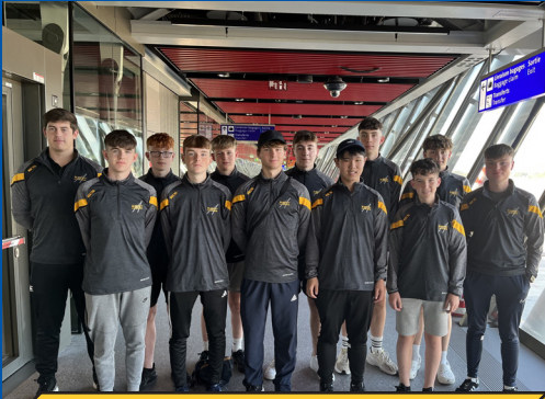
Arrivée à l'aéroport de Genève