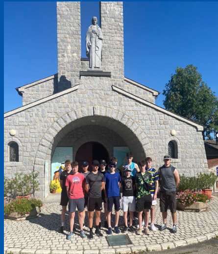
Église de La Rosey