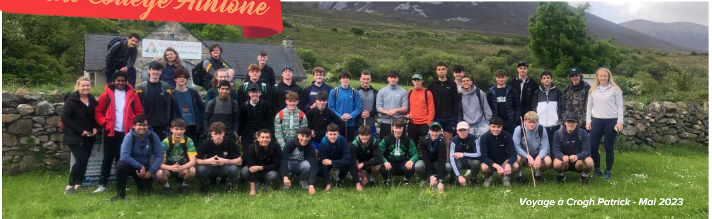
Voyage à Crogh Patrick - Mai 2023

en leadership et rencontrer d'autres responsables d'écoles maristes d'Écosse et d'Irlande. Le voyage comprenait différentes activités de leadership et des activités sociales avec les autres écoles. Chaque groupe a dû faire une présentation de son école et de la variété des activités réalisées dans le cadre du programme Marist Leader. Cela nous a aidés à ramener des idées dans notre propre école, par exemple en laissant les élèves décorer l'école pour Noël et en organisant différents types de collectes de fonds. Le voyage a contribué à améliorer nos compétences sociales et à faire de nous de meilleurs leaders.