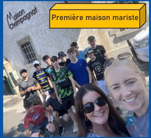
Première maison mariste