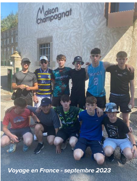
Voyage en France - septembre 2023

Pour marquer la fin de l'année scolaire l'année dernière, les responsables maristes et leurs coordinateurs ont marché sur les traces de notre fondateur Champagnat en prenant la direction des montagnes. Le groupe a grimpé jusqu'à Crogh Patrick sous un soleil radieux et est redescendu entier. Ce fut une journée merveilleuse au cours de laquelle les responsables maristes ont pu réfléchir à l'année écoulée et en prévoyant d'organiser une activité similaire à la fin de cette année scolaire.