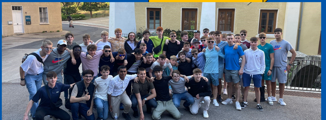
Une soirée à Saint-Étienne avec d'autres responsables maristes