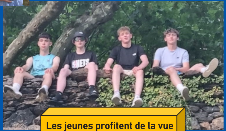
Les jeunes profitent de la vue