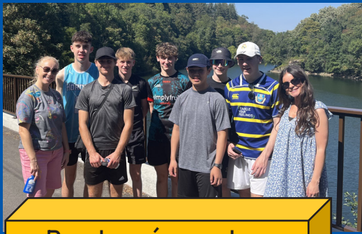
Randonnée sur les traces de Marcellin