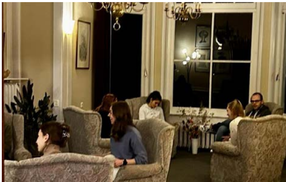
From the newsletter prepared by Ineke Tacq

Une perspective différente sur les conflits n'est pas seulement un concept théorique ; c'est une attitude face à la vie qui nous invite à affronter les conflits avec courage, compréhension et compassion. Si nous adoptons collectivement cette approche, nous pouvons créer un monde où les conflits ne sont plus redoutés, mais considérés comme des occasions précieuses de croissance et de connexion.