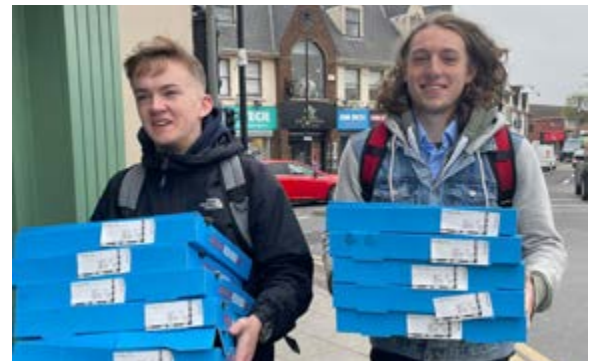
Les gagnants du Quiz de la Semaine Debout 6.5 ont gagné une soirée pizza pour leur classe.