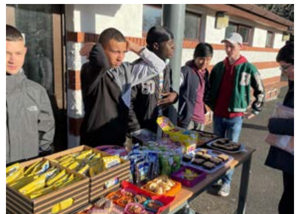
Vente de gâteaux de la Semaine Debout - Nous avons récolté 1757 euros pour BelongTo!