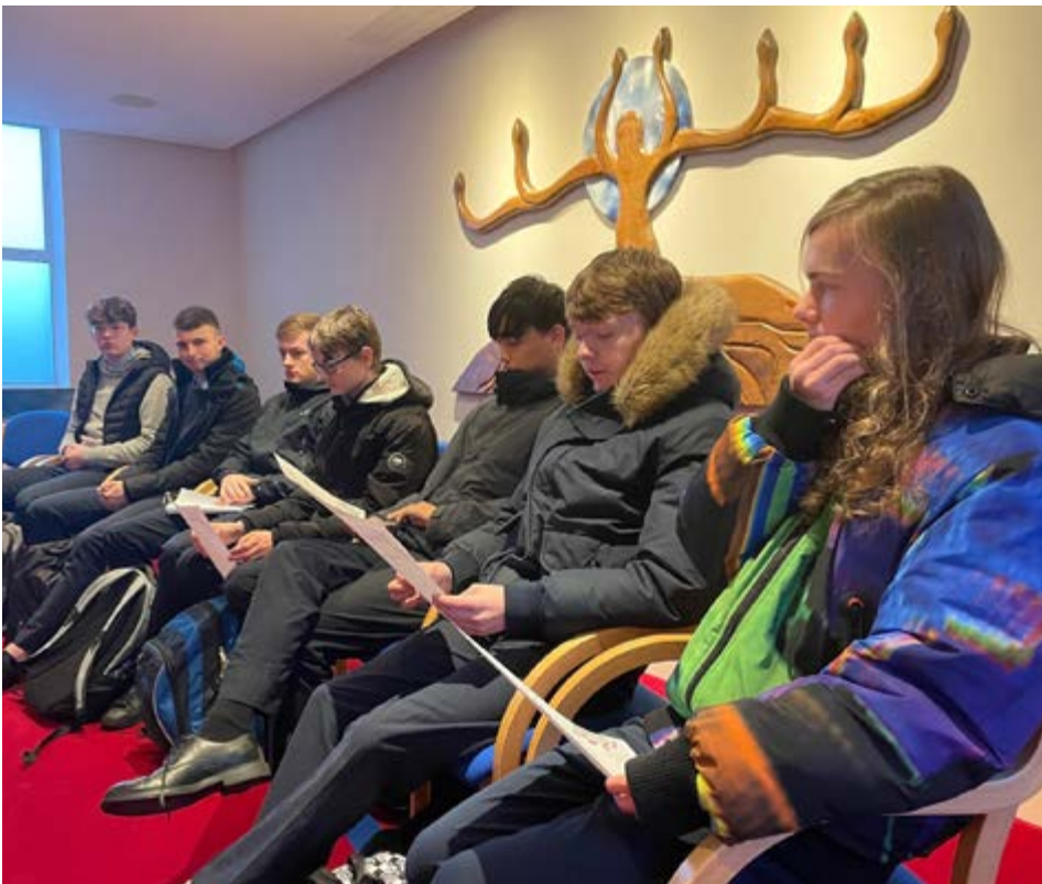
Les leaders maristes qui ont voyagé à L'Hermitage ont présenté leurs réflexions dans notre espace sacré à l'équipe centrale mariste