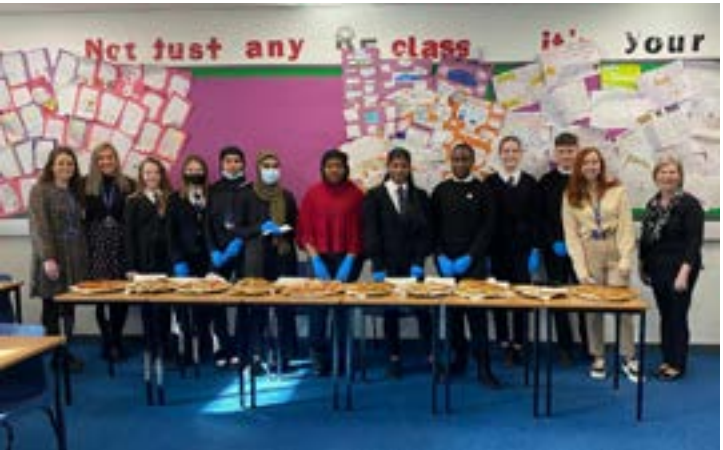
Les étudiants ont vendu des crêpes afin de récolter des fonds pour l'appel d'urgence du SCIAF Ukraine