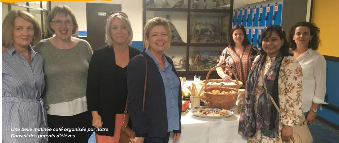
Une belle matinée café organisée par notre Conseil des parents d'élèves