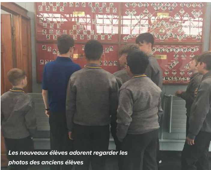
Les nouveaux élèves adorent regarder les photos des anciens élèves