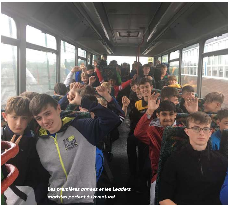
Les premières années et les Leaders maristes partent à l'aventure!

En tant que dirigeants maristes, notre année est marquée par des projets et des événements basés sur nos valeurs maristes. Il y a en premier lieu la valeur de la présence attentive.