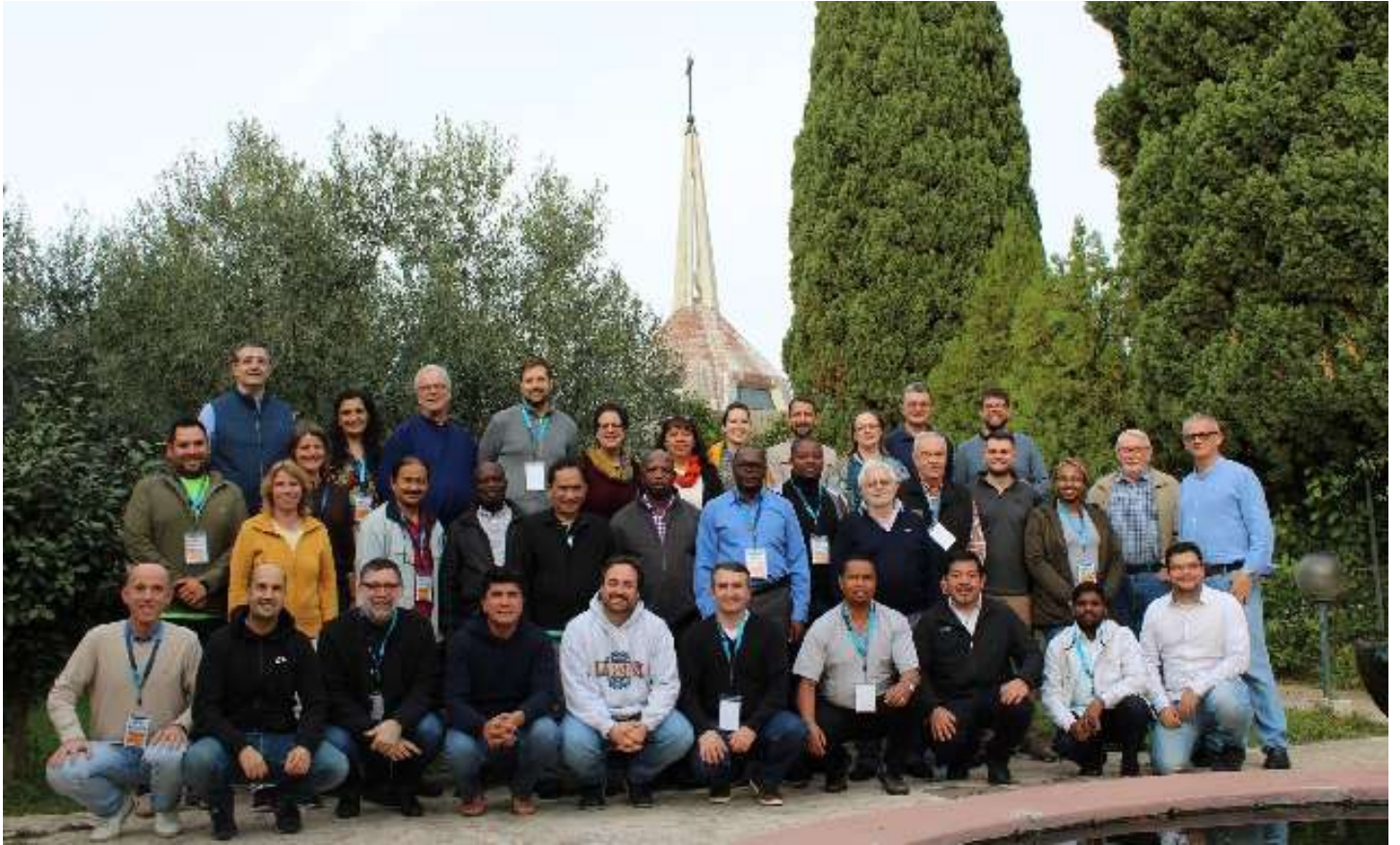
Photo de groupe des participants au CPV à Rome, en novembre 2019.